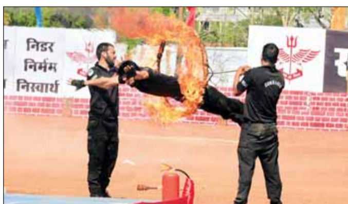
एनएसजी कमांडोज हैरतअंगेज प्रदर्शन करते हुए

एक माह तक चलेगा एनएसजी एवं मप्र पुलिस का यह साझा प्रशिक्षण कार्यक्रम