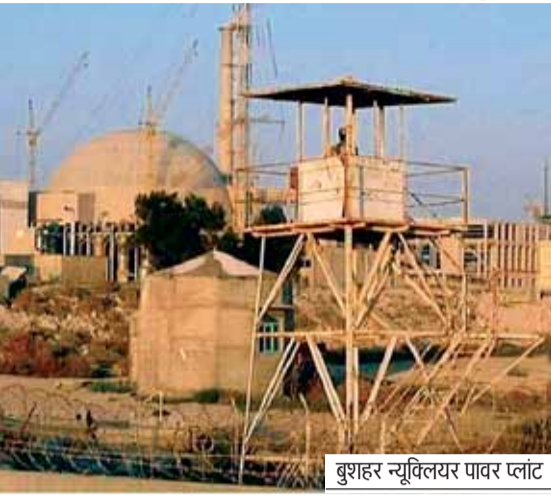
बुराहर न्यूक्लियर पावर प्लांट

ईरान ने आईईए से कहा- आपकी चुप्पी हमलावरों को दे रही बढ़ावा, रेंडिशन लीक की दी चेतावनी