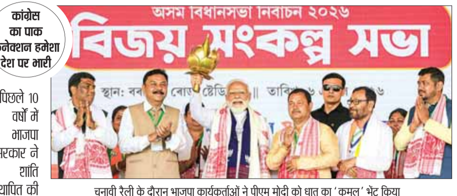
चुनावी रैली के दौरान भाजपा कार्यकर्ताओं ने पीएम मोदी को धातु का 'कमल' भेंट किया

पीएम ने कहा कि कांग्रेस ने हमेशा अल्पकालिक उपायों पर ध्यान केंद्रित किया, ताकि वे भ्रष्टाचार में लिप्त हो सकें। इसके विपरीत, भाजपा राष्ट्र के दीर्घकालिक विकास के लिए काम करती है और समाज के सभी वर्गों के समग्र विकास को सुनिश्चित करती है।