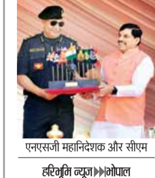
एनएसजी महानिदेशक और सीएम

मुख्यमंत्री डॉ. मोहन यादव ने कहा कि किसी भी प्रकार के टेरिस्ट अटैक से निपटने के लिए हम अपने सुरक्षा बलों, एटीएस और काउंटर टेररिज्म ग्रुप (सीटीजी) को और अधिक मजबूत करेंगे। सीटीजी के आधुनिकीकरण के लिए सरकार ने 200 करोड़ रुपए की डीपीआर तैयार की है। जल्द ही इस दिशा में आगे बढ़ने जा रहे हैं। मुख्यमंत्री ने घोषणा की कि टेरिस्ट अटैक को पूरी दृष्टता से काउंटर करने सभी जरूरी प्रशिक्षण के लिए हमारी सरकार भोपाल जिले की हुजूर तहसील के ग्राम तूमड़ा में अत्याधुनिक प्रशिक्षण केंद्र खोलेगी। इस सेंटर के जरिए हम अपने सुरक्षा बलों को किसी भी प्रकार की आकस्मिक आपदा एवं अतिवादी ताकतों से निपटने के लिए पूरी क्षमता से तैयार करेंगे।