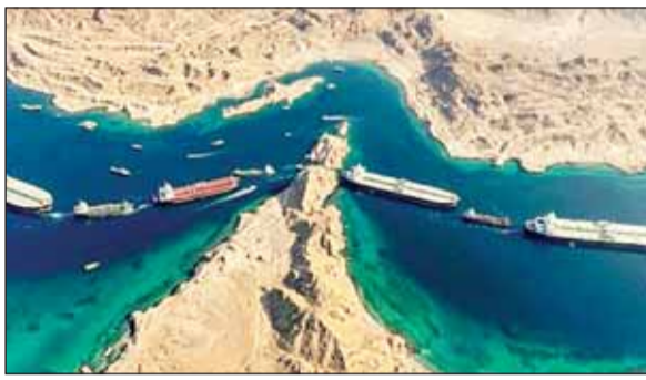
होमूज का यह स्थान, जहां जहाज फंसे हुए हैं

सूत्रीय प्रस्ताव अत्यधिक मांगों वाला है। हमने अपनी मांगों का एक अलग सेट तैयार कर लिया है और उसे औपचारिक रूप दे दिया है। इस संभावना को नजरअंदाज नहीं किया जा सकता है कि इस्फ़हान में पायलट बचाव अभियान केवल एक छल-कपट था, जिसका मकसद ईरान के संवर्धित यूरेनियम को जब्त करना था। मंत्रालय ने कहा कि ओमान के साथ बातचीत का फोकस होमूज जलडमरूमध्य के जरिये जहाजों के सुरक्षित मार्ग के लिए एक प्रोटोकॉल बनाने पर है।