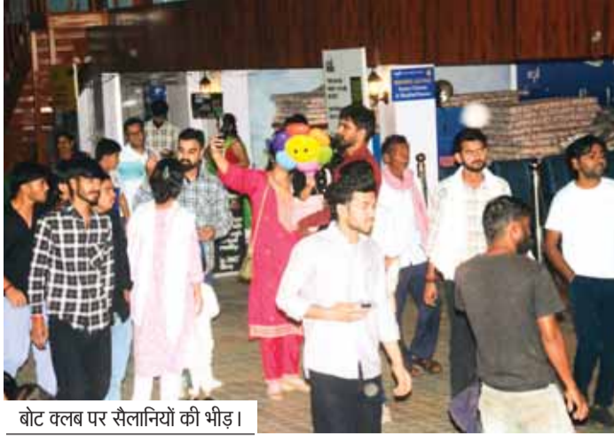
बोट क्लब पर सैलानियों की भीड़।

बोट क्लब, वनविहार, मनुआभान की टेकरी, चिड़ियाटोल, कंकाली मंदिर के रास्ते पर सड़क किनारे तक टहलते देखे लोग