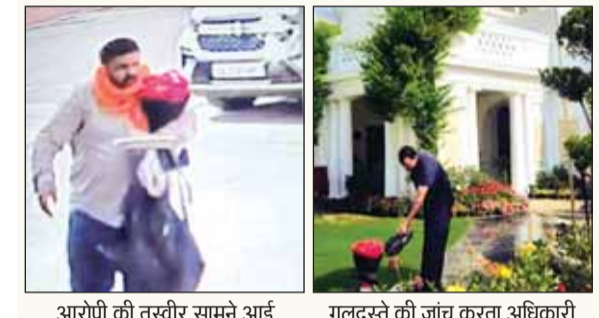
आरोपी की तस्वीर सामने आई गुलदस्ते की जांच करता अधिकारी