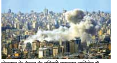
लेबनान के बेरुत के दक्षिणी उपनगर दाहियेह में इजराइली हवाई हमलों से हुआ धुआं-धुआं